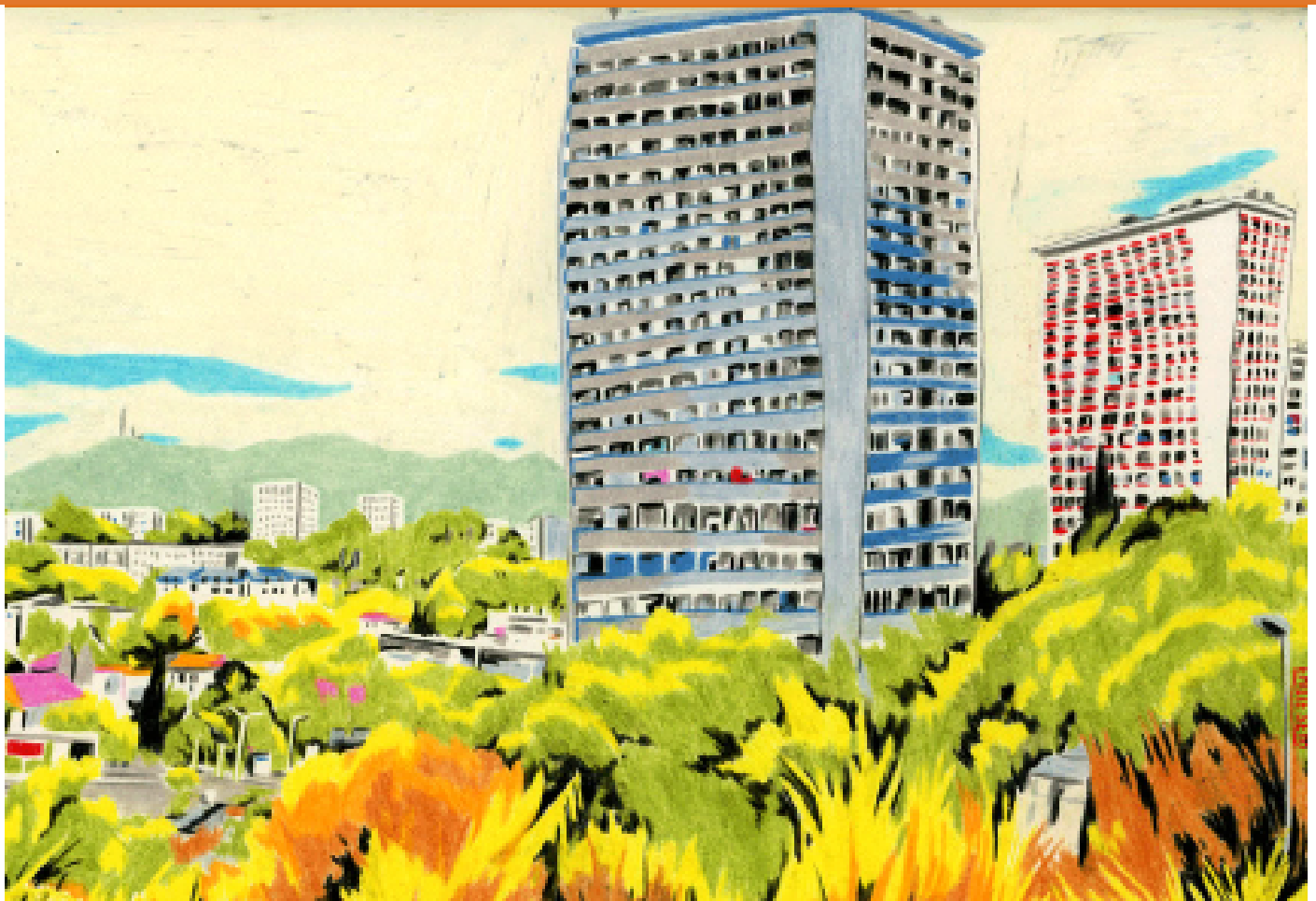
Illustration : Emilie Solu. Tous droits réservés

Musée d'histoire de Marseille 7 rue Henri Barbusse, 13001